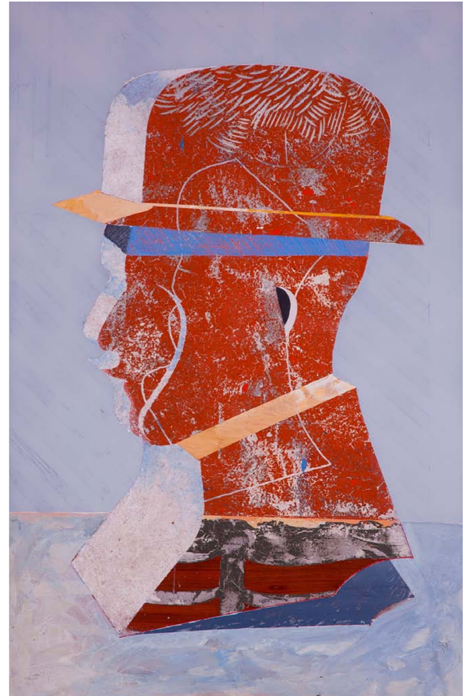
Notario naranja Maderas, resina y pigmento 200 x 135 cm. 2011