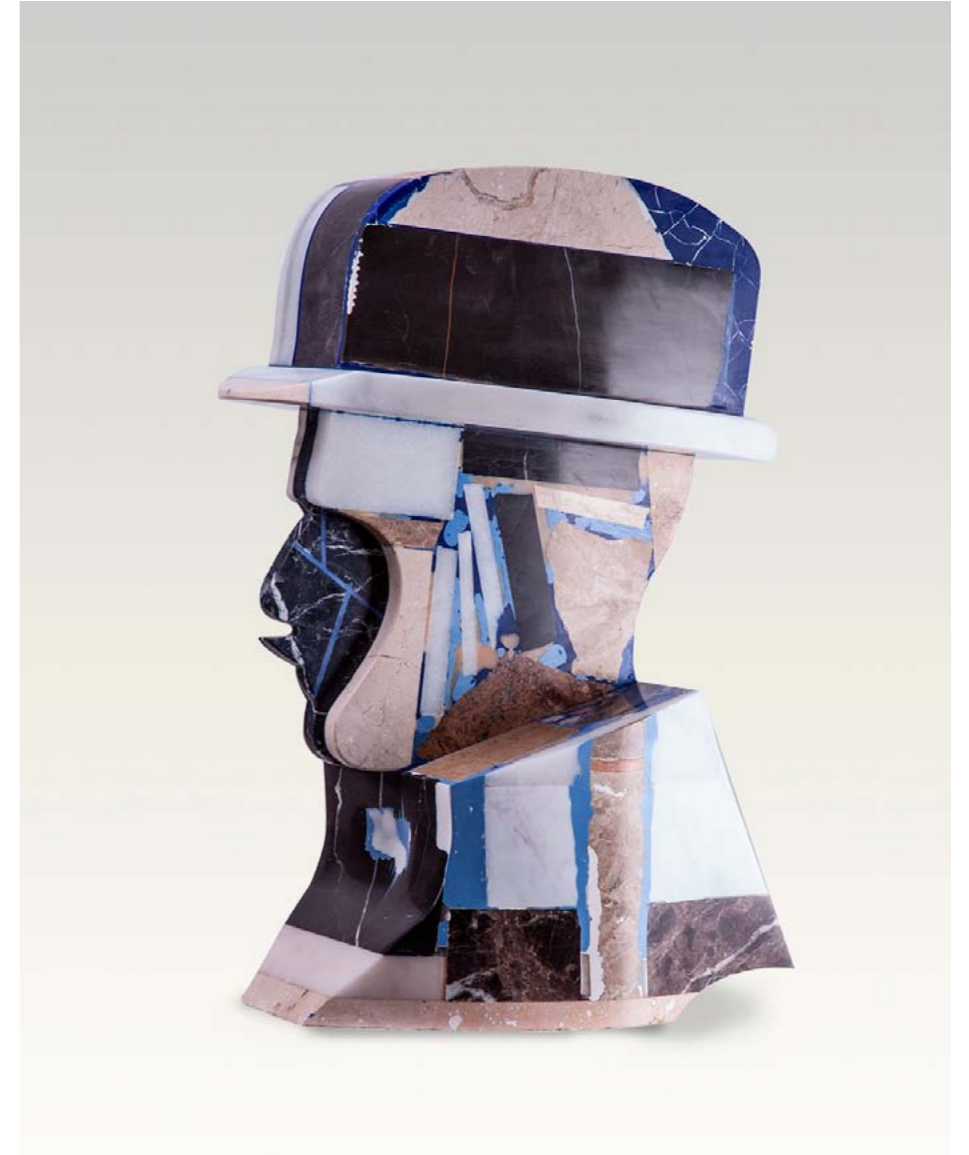
Notario Piedra Mármol, resina y pigmento 60 x 45 x 40 cm. 2012