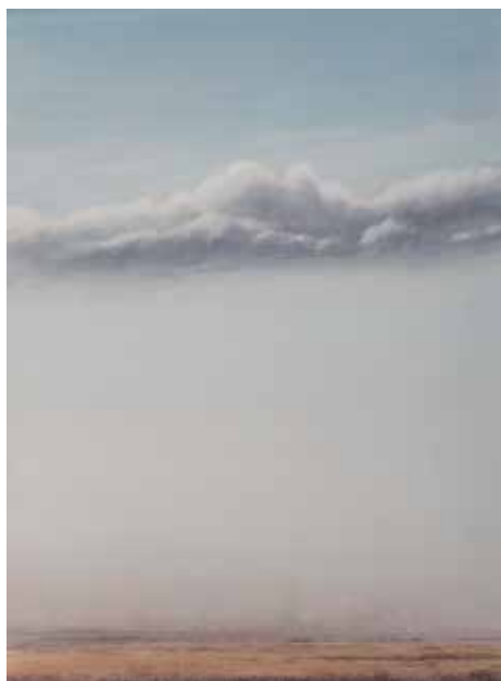
CASTILLA 84 x 62 cm