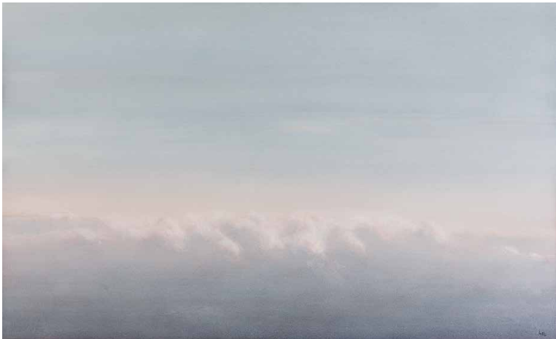
DULCE ABISMO Juan Díaz Acuarela 90 x 150 cm