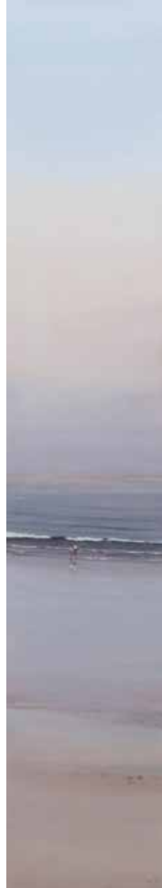
OYAMBRE Juan Díaz Acuarela 138 x 25 cm