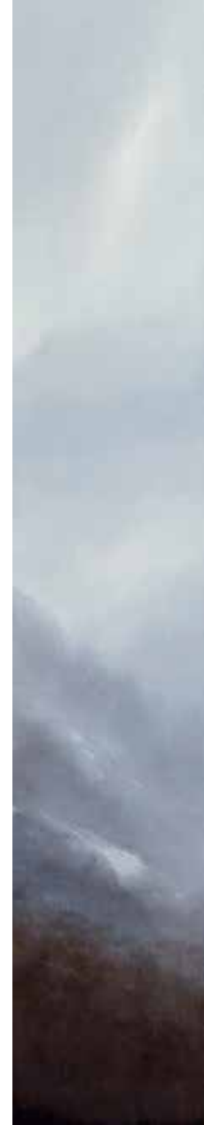
QUIRÓS III Juan Díaz Acuarela 138 x 25 cm