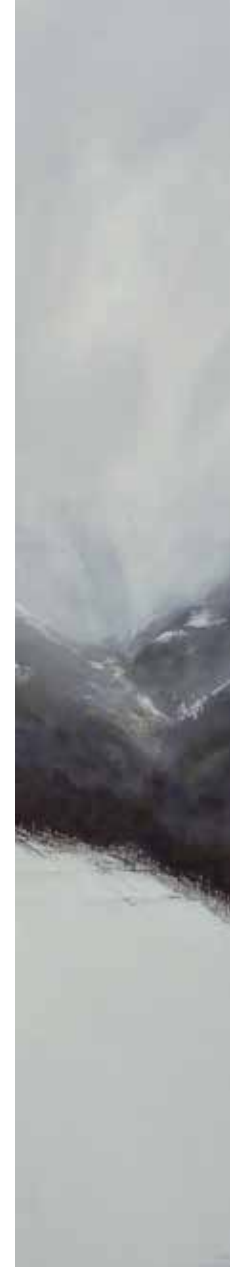
HUERNA IV Juan Díaz Acuarela 138 x 25 cm