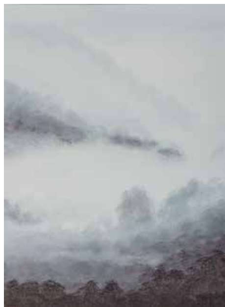
NIEBLAS IV 84 x 62 cm