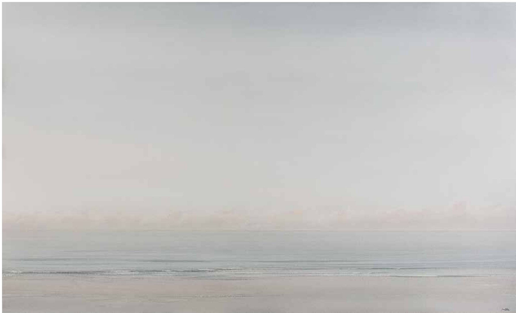
PLAYA Juan Díaz Acuarela 90 x 150 cm