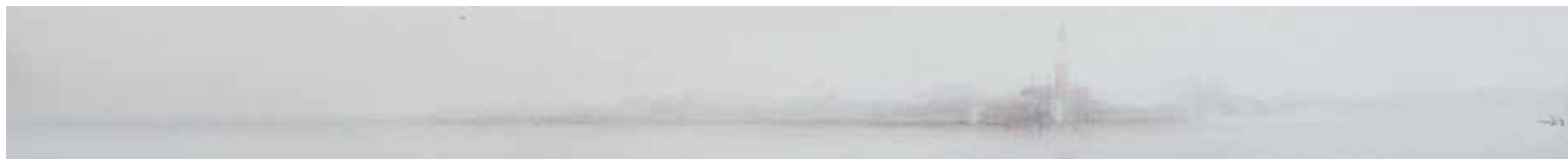
SAN GIORGIO (VENEZIA) Juan Díaz Acuarela 16 x 141 cm