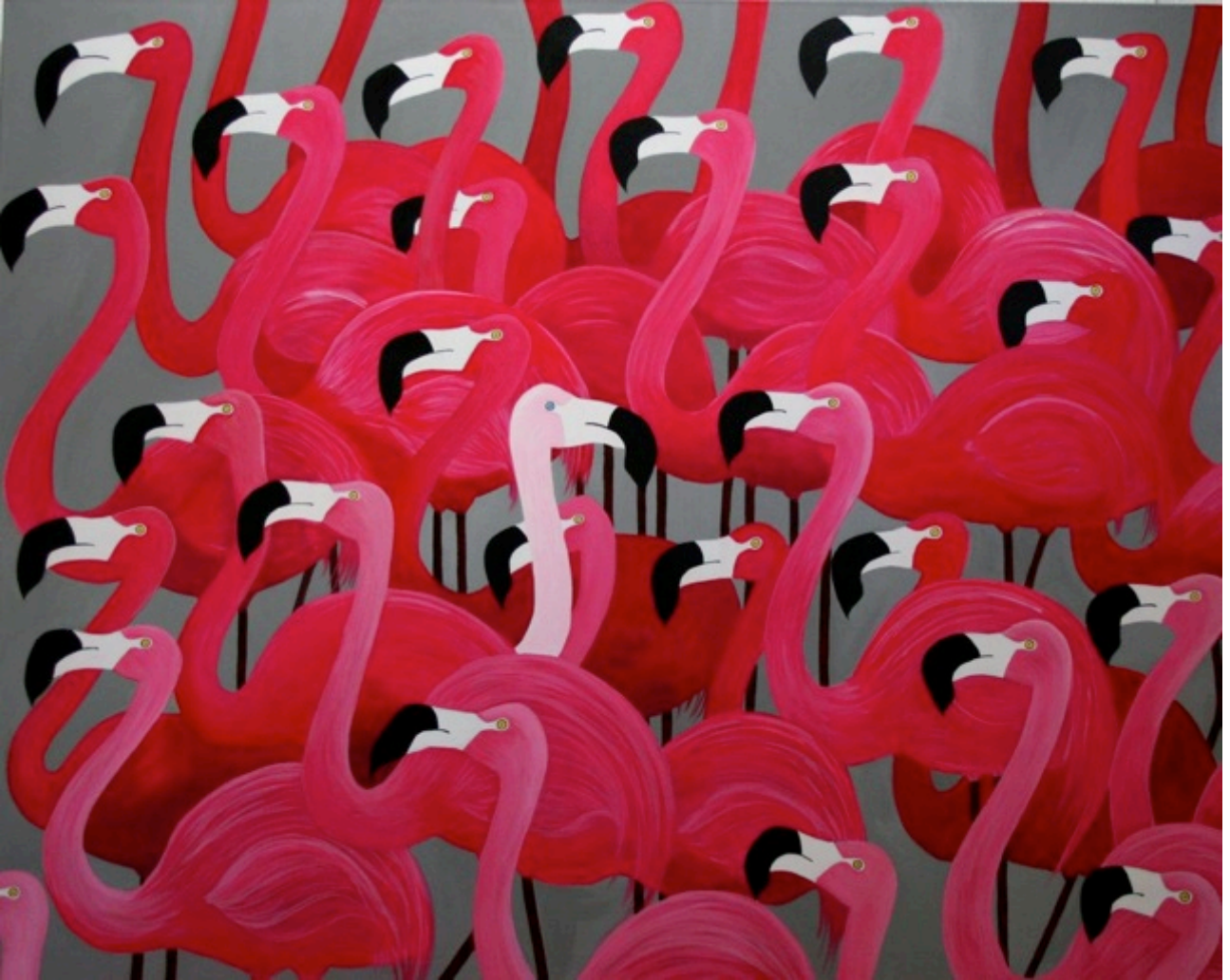
Don't be normal. Acrílico sobre lienzo. 130 x 160 cm.