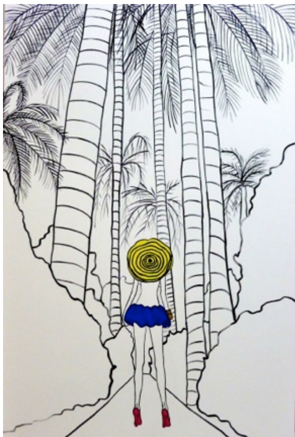
Miami. Acrílico sobre lienzo. 150 x 100 cm.

2010 "ATTITUDE" Lasal de Montalban.Madrid 2011 "MOVING ON" Lasal de Montalban. Madrid 2012 "CAN-DO" BFC ARTROOM. MADRID 2012 "FLAMINGO LAND" BFC ARTROOM. MADRID