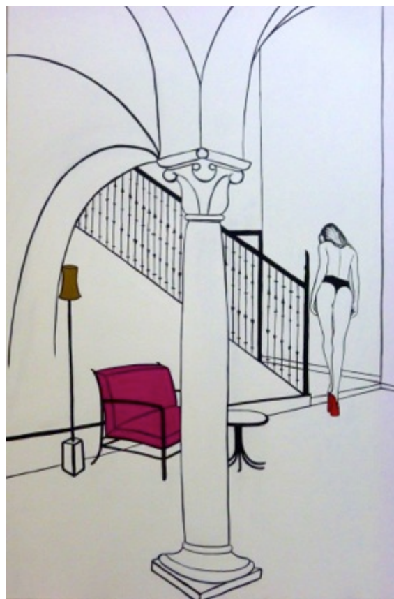
Milán. Acrílico sobre lienzo 150 x 100 cm.