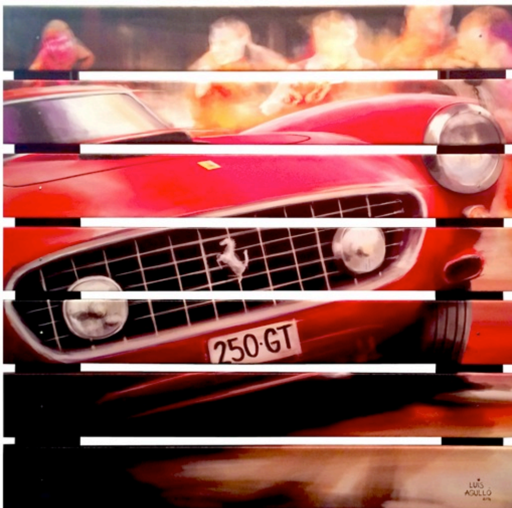
Metamorphosis. Digital Art/lienzo/madera. 100 x 100 cm.