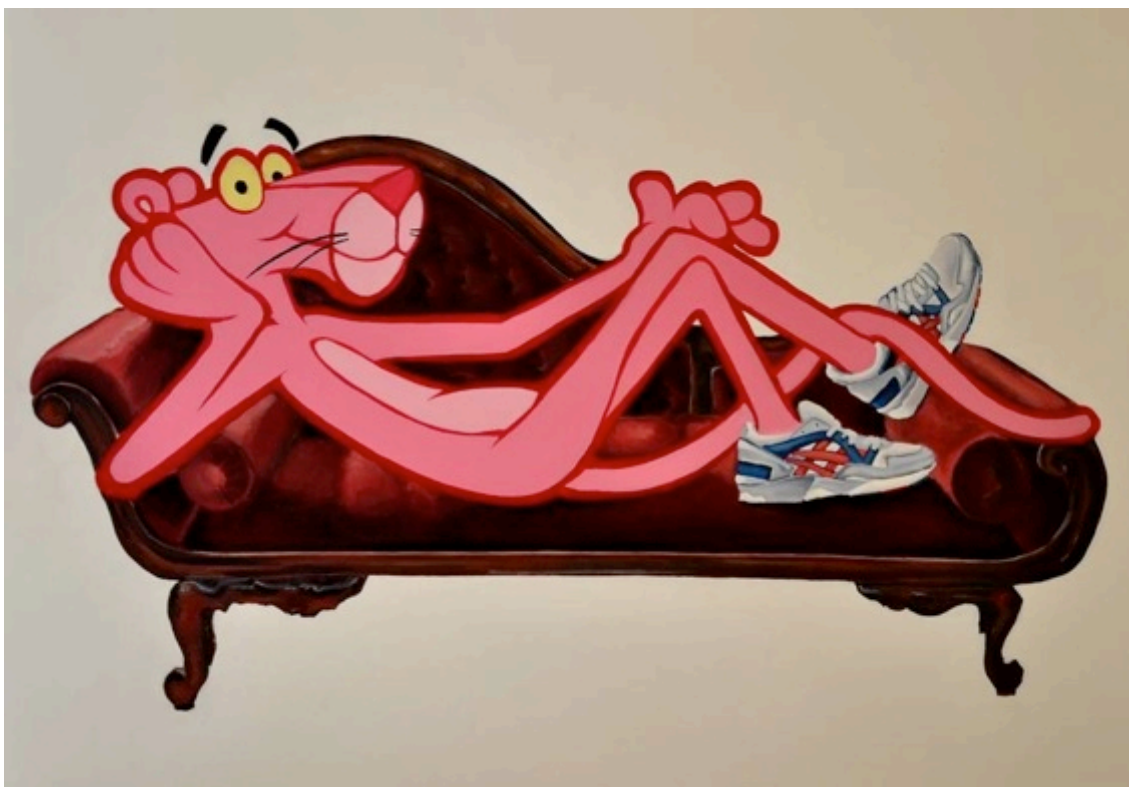
Chilling. Óleo sobre lienzo. 90 x 130 cm.