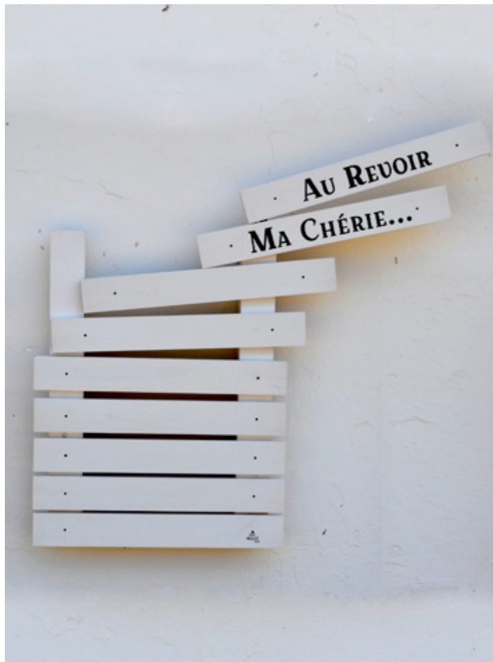
Indépendance. Acrílico sobre madera. 90 x 60 cm.