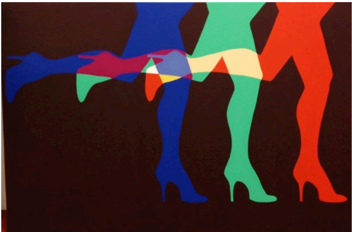
Pop midnight runner. Acrílico sobre lienzo. 100 x 150 cm.