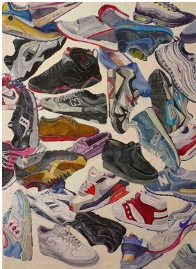
Ensalada. Óleo sobre lienzo. 100 x 75 cm.