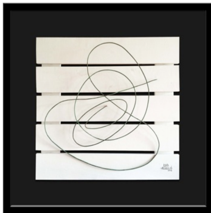
Querencia 1. Alambre de cobre sobre madera. 100 x 100 cm.

Agulló ha realizado numerosas exposiciones individuales y en los últimos meses ha expuesto su obra en ferias las internacionales de Bruselas y Busán, en Corea del Sur.