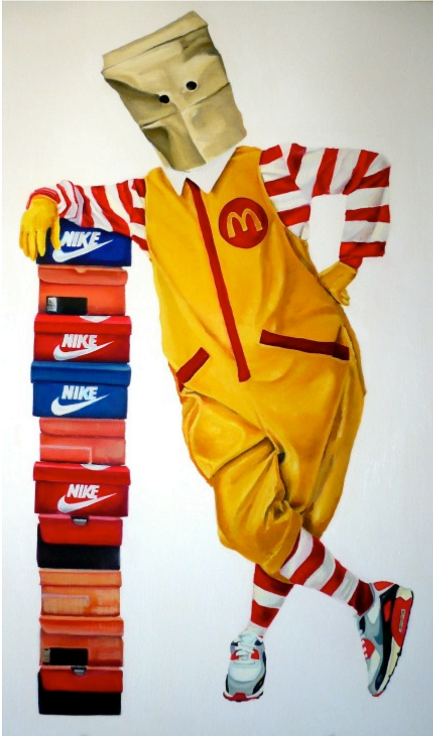
Run Ronald Run. Óleo sobre lienzo. 114 x 73 cm.